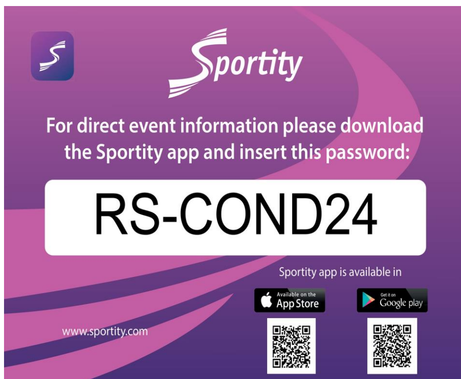
TABLEAU OFFICIEL AFFICHAGE VIRTUEL

VOTRE INSCRIPTION DOIT SE FAIRE UNIQUEMENT EN LIGNE. TOUS LES DOCUMENTS ET LES ANNEXES S'Y RAPPORTANT SERONT AUTOMATIQUEMENT GENERES PAR L'APPLICATION (ENGAGEMENT EN LIGNE) LES DOCUMENTS VOUS SERONT TRANSMIS PAR COURRIEL DES QUE LA PROCEDURE SERA COMPLETEMENT ET OFFICIELLEMENT FINALISEE